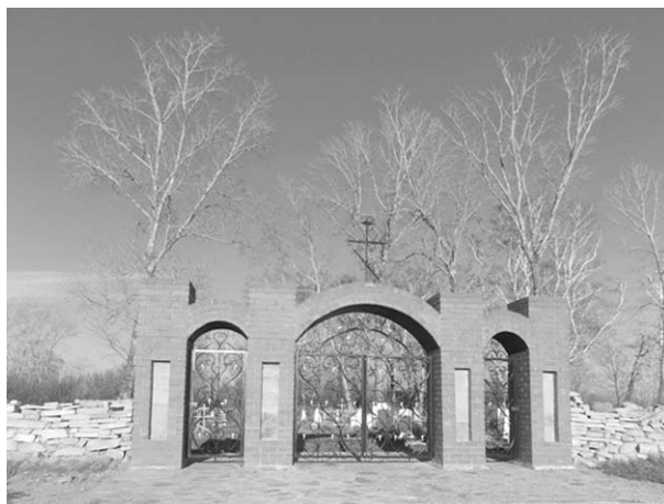
Великопетровское кладбище.