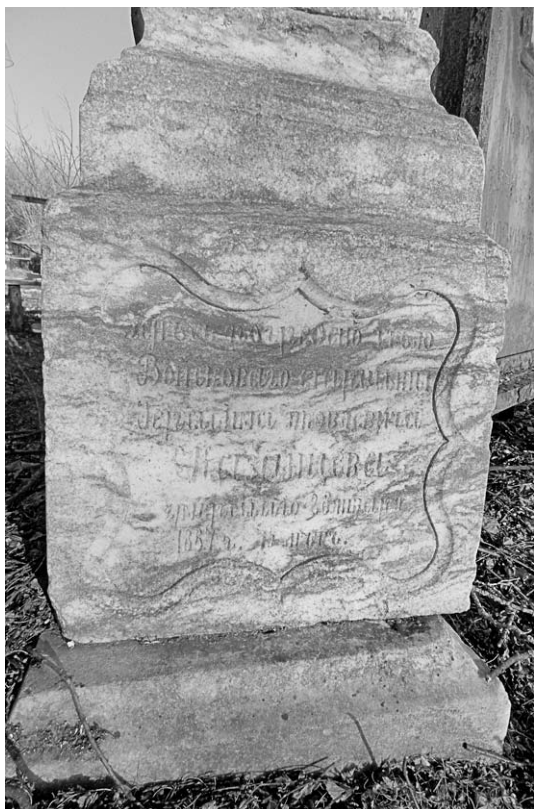
Надпись на лицевой стороне памятника.