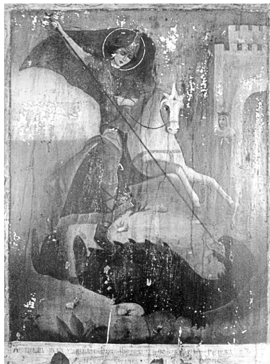
Жертвованная икона «Чудо Георгия о змии». Поселок Бреды, начало XX в.

«Церковь и официальное вероучение, с одной стороны, и набожность паствы — с другой, представляют собой хотя и пересекающиеся, но все же не совпадающие явления... В России, где полный текст Библии впервые был издан лишь в 1876 г., оставаясь недоступным для большей части православного населения по причине его неграмотности, связь населения с церковью осуществлялась преимущественно через участие в религиозных ритуалах, дополняясь «домашней