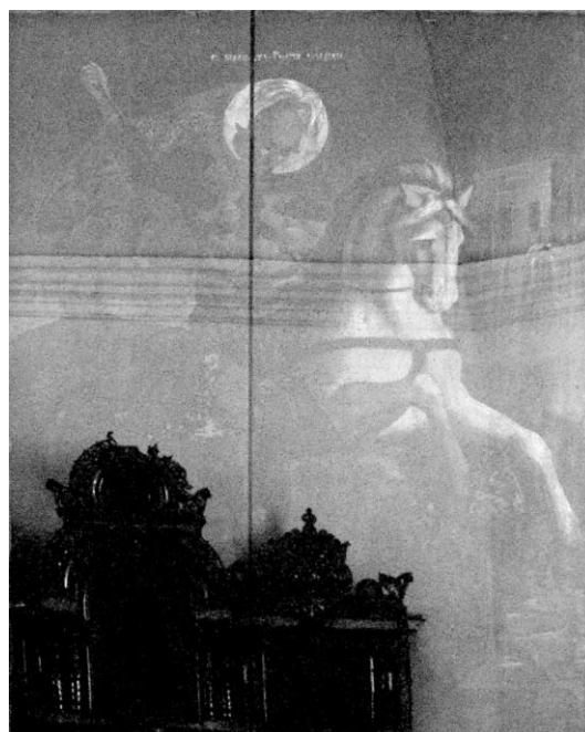
Жертвованная икона «Чудо Георгия о змии». Верхнеуральск, начало XX в.

Если мы говорим про жертвованные иконы оренбургских казаков, то ярким